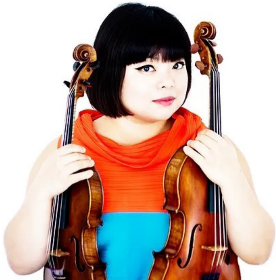
Yura Lee Mentor Violon & Alto

La violoniste et altiste Yura Lee est l'une des artistes les plus polyvalentes et les plus fascinantes d'aujourd'hui. Elle est l'une des rares au monde à maîtriser à la fois le violon et l'alto, et elle joue activement des deux instruments de manière égale. Sa carrière s'étend sur différents supports musicaux : à la fois comme soliste et comme musicienne de chambre, captivant le public avec de la musique allant du baroque au moderne, et jouissant d'une carrière qui s'étend sur plus de deux décennies et qui l'emmène dans le monde entier.